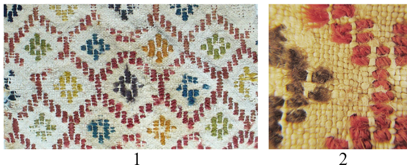
Рис. 5. Фрагмент льняной наволочки с декором в технике броше, найденный в некрополе Дэйр-эль-Банат: 1 — фрагмент ткани; 2 — микрофотография участка с декором