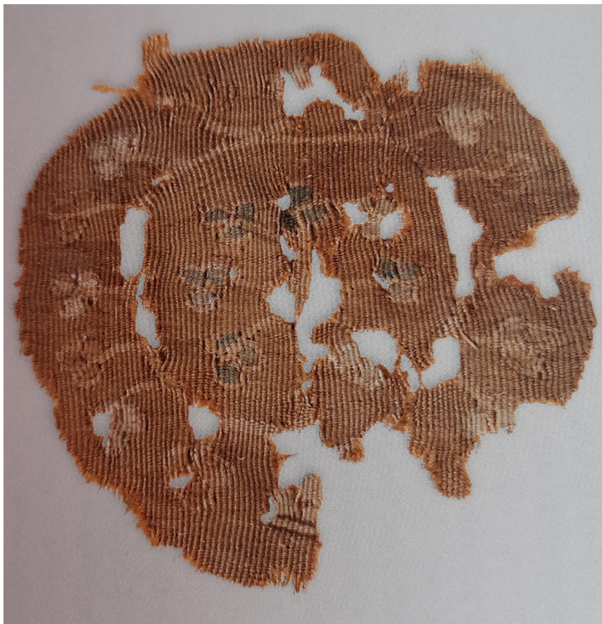
Рис. 2. Шерстяной орбикул из коллекции Государственного Эрмитажа (по Иерусалимская 2012: 143)

Они ткались как гобеленовые вставки при изготовлении всего изделия. Однако в процессе бытования декор мог вырезаться из одного изделия и нашиваться на совершенно другое. Поэтому неизвестно, в каком виде данный медальон попал на территорию Алании: как украшение предмета одежды или как аппликация, пришитая на какое-то другое текстильное изделие.