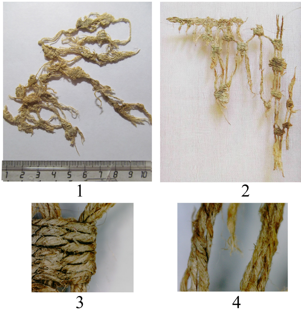
Рис. 3. Фрагмент льняного изделия с гобеленовой вставкой из коллекции музея САО РАН и Нижнего Архыза: 1 — до устранения деформации; 2 — после устранения деформации; 3 — микрофотография участка вставки, где сохранились нити льняного утка; 4 — микрофотография нитей основы