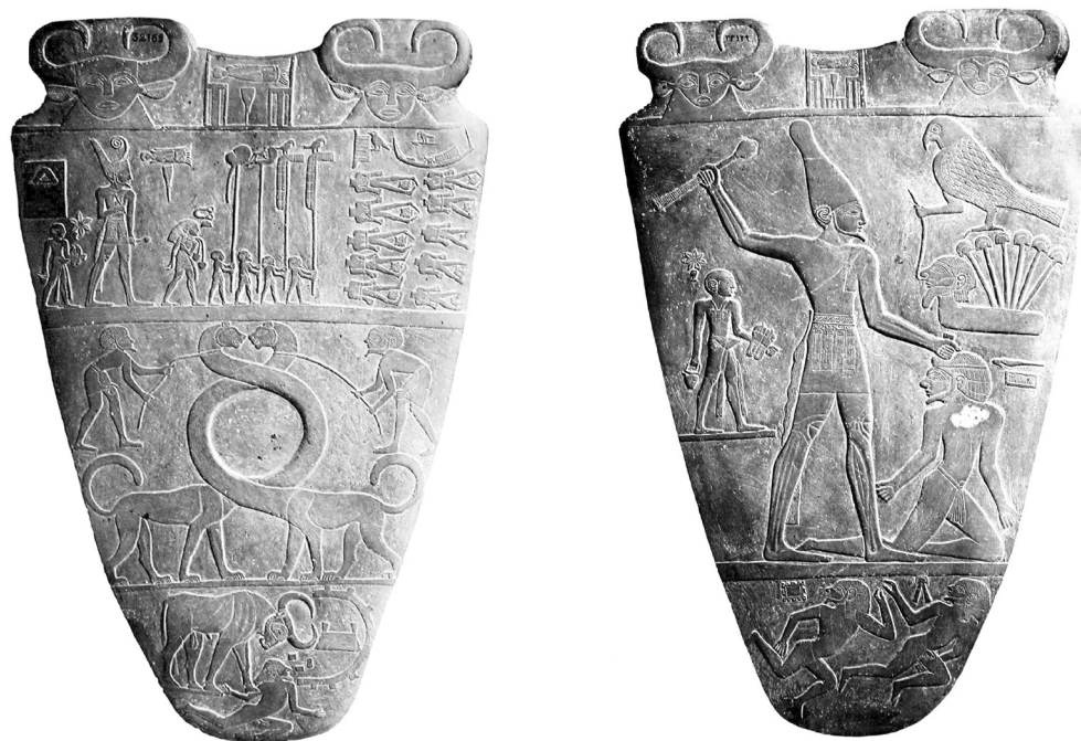
Рис. 1. Аверс и реверс палетки Нармера